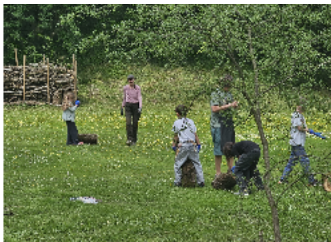
Die Kinder des Schülerhortes Hötting-West beim Transport der Stämme für die Benjeshecke.

Verfügung stellte. Zusätzlich halfen sieben Freiwillige im Rahmen der Caritas Freiwilligenwoche. Die Hecke wurde am westlichen Ende des Spiel- und Naturparks in Hötting-West errichtet. Zuerst wurden die Pfosten (Begrenzung der Hecke) händisch in den Boden geschlagen. Für die Befüllung konnte das Holz und die Äste von zwei gefällten Pappeln verwendet werden. Auch die Kinder und Betreuer:innen vom Schülerhort Hötting-West unter der Leitung von Georg Kritzinger waren beim Transport der Äste beteiligt. Nun kann die Tier- und Pflanzenwelt diesen Lebensraum erobern. In den nächsten Jahren soll die Hecke weiter ergänzt und gepflegt wer-