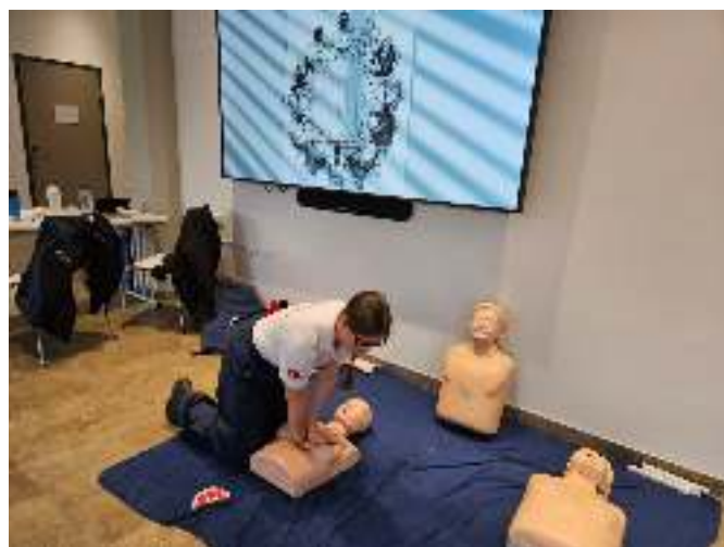
Üben für den Ernstfall: Im Rahmen eines Tages der offenen Tür an der Medizinischen Universität Innsbruck wird die lebensrettende Herzdruckmassage an einem speziellen weiblichen Übungs-Dummy trainiert.