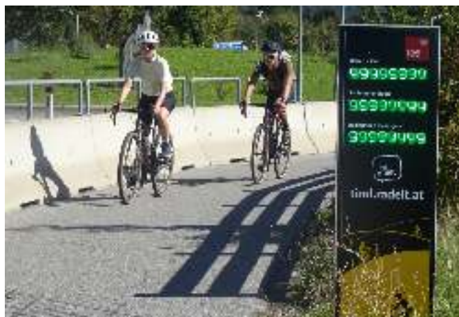
Die Zählmaschine zählt nicht mehr, „Alle Neune!“

Über dieses QR-Code zu den Quizzen des Bundeskriminalamtes