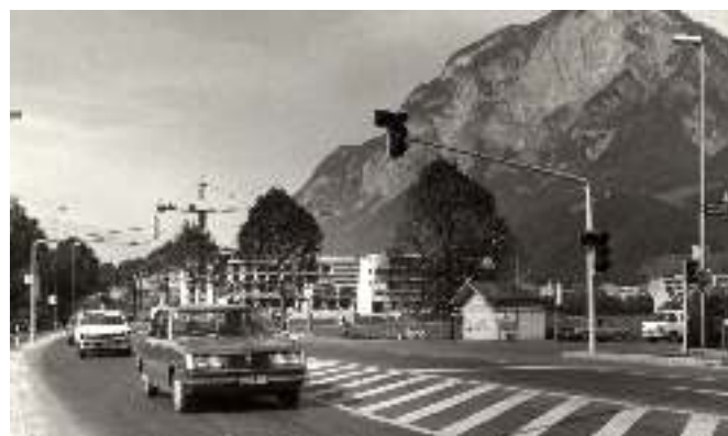
Im Zuge der Verkehrsampelinbetriebnahme an der Kreuzung Kranebitter Allee/Technikerstraße wurde vom unbekanntem Fotograf "nebenbei" auch das Mannerhäusel fotografiert.

Ph-G-17653