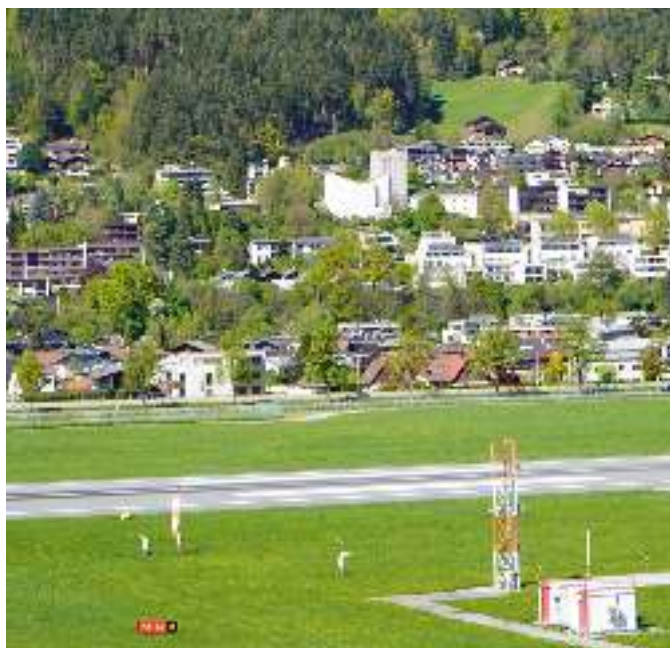
Vom Flughafen-Tower fotografiert: Der eingerüstete Kirchturm der Kirche Allerheiligen.

nach einer Clearance durch die Austro Control auf dem Flughafentower den