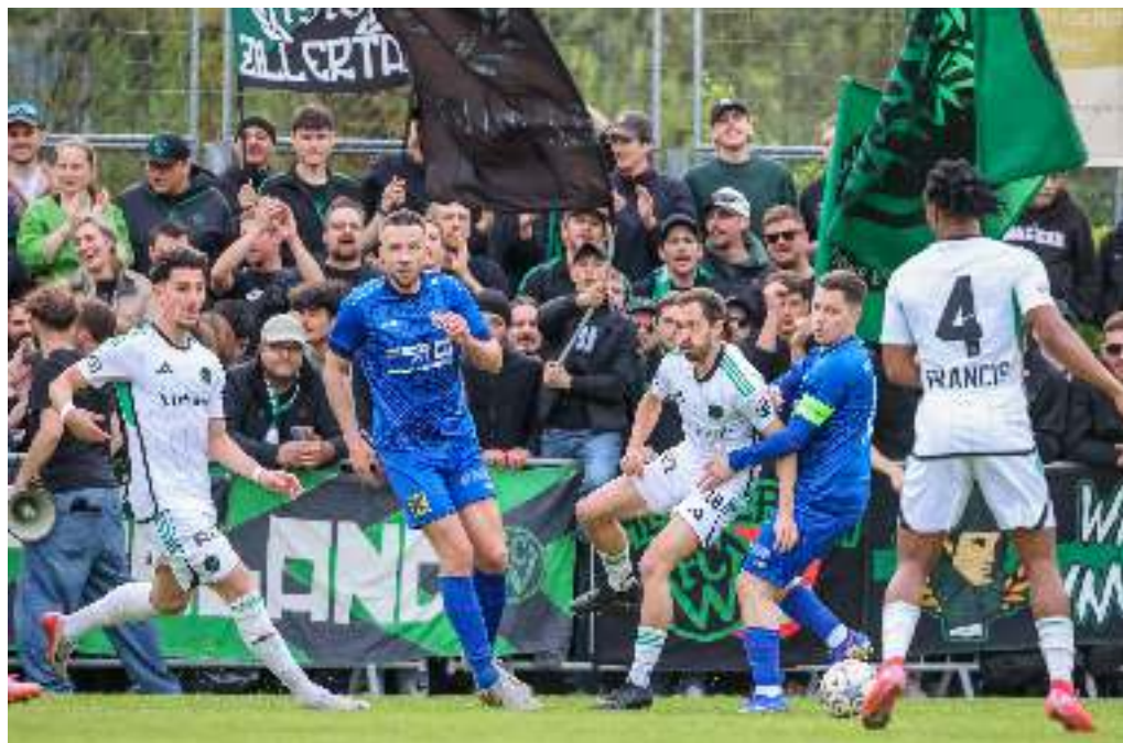
Viertelfinale des Kerschdorfer Tirol Cups 2025/26: SPG Innsbruck West - FC Wacker Innsbruck