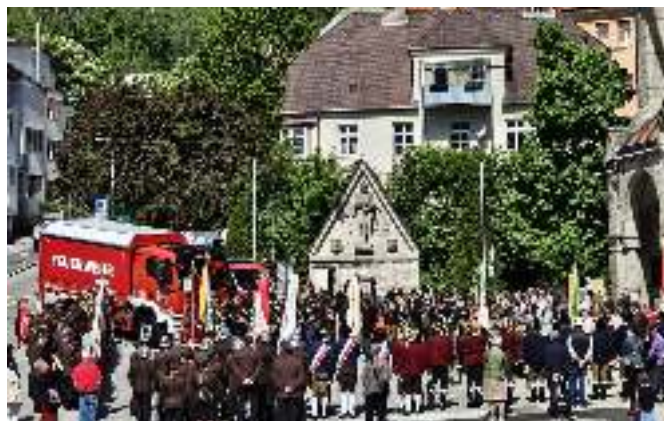
Fahrzeugweihe und großer Festakt der Höttinger Feuerwehr zur Florianifeier. Ihr Einsatzgebiet umfasst auch Hötting-West und Kranebitten.

hineinzulaufen, wo andere hinausrennen, und Stärke, um die psychischen und physischen Belastungen eines Feuerwehreinsatzes zu bewältigen. Nach der Messe verlagerte sich das Geschehen auf den sonnenübergossenen Kirchenvorplatz. Es war ein imposantes Bild: Abordnungen der anderen Innsbrucker Feuerwehren und Vertreter der übergeordneten Kommanden sowie Abordnungen der Schützen aus dem gesamten Schutzgebiet erwiesen der Höttinger Feuerwehr die Ehre. Besonders feierlich wurde es bei der Segnung der neuen Einsatzfahrzeuge LASTA (320 PS) und MIFA (180 PS). Danach schritten Feuerwehrkommandant Muglach und Bürgermeister Anzengruber zur Tat und ehrten verdiente Mitglieder. Ein besonderes Highlight der diesjährigen Feier war der Fokus auf die Jugend. Es war eine Freude zu sehen, mit wie viel Eifer die Feu-