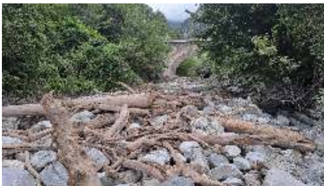
Ausbaggerung im März 2024