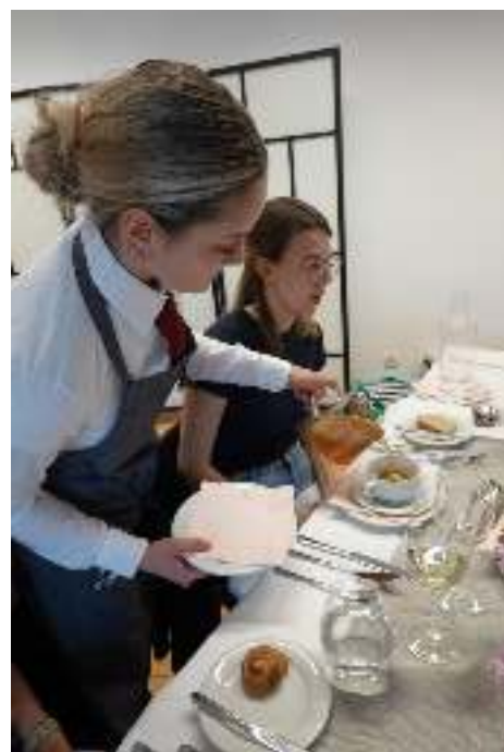
Die SchülerInnen der HLWest verwöhnten die Gäste kulinarisch