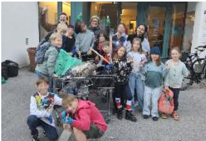
Die jungen HelferInnen und sämtliche BetreuerInnen des Schülerhortes Hötting-West unterstützten die Müllsammelaktion tatkräftig.