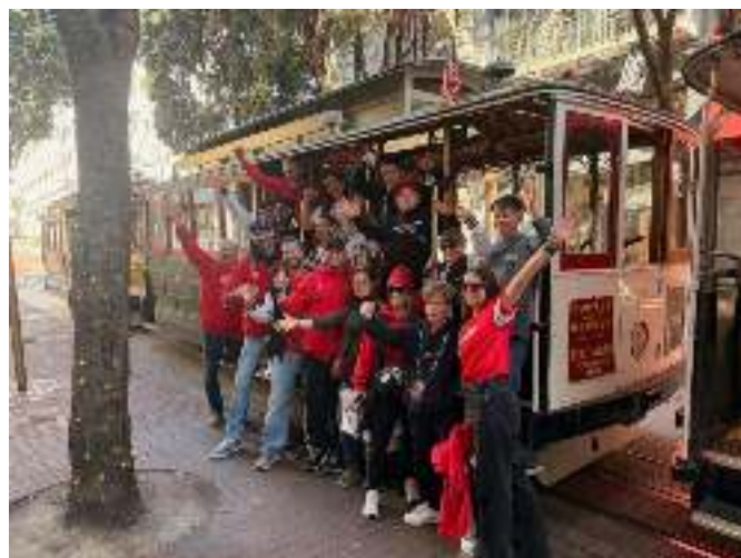
Unsere Footballmannschaft im Cablecar in San Francisco